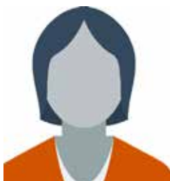
Pr Samira Azzabi Tunisie